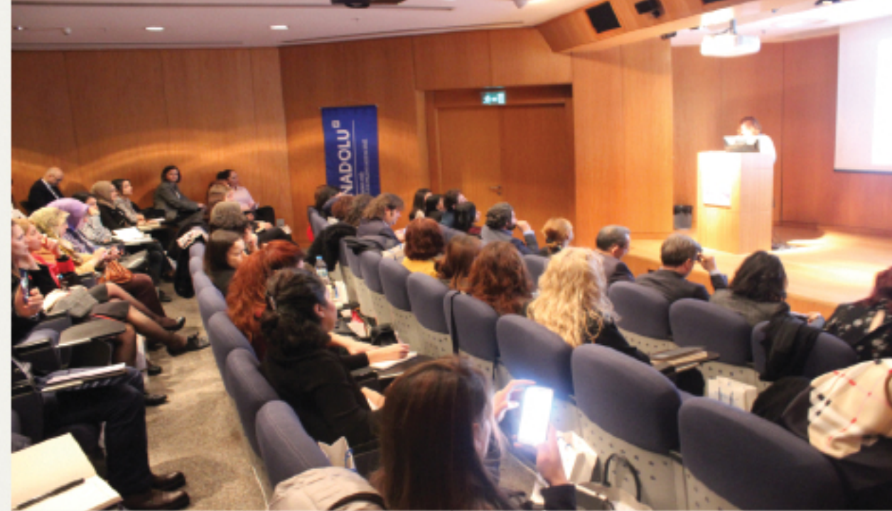
Hasta Güvenliği Çalıştayı Anadolu Sağlık Merkezi'nde gerçekleşti