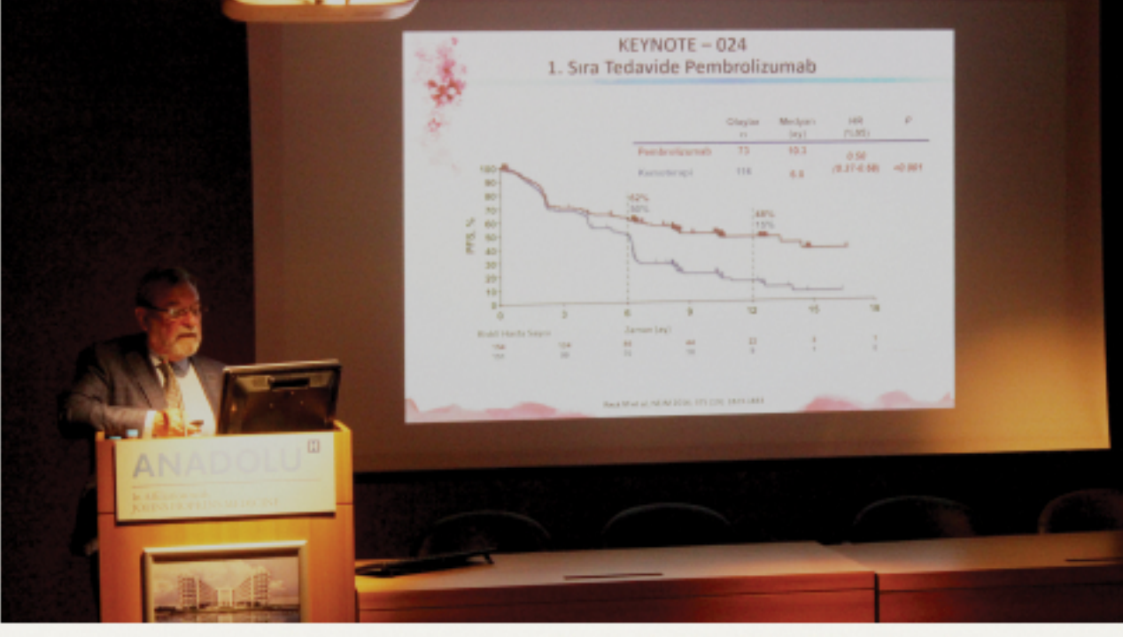
Onkolojik Bilimler Konferansı - 4