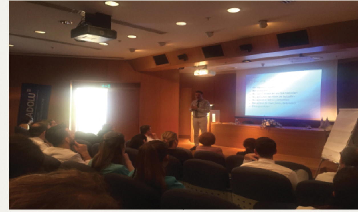
Omurga Sağlığı Semineri