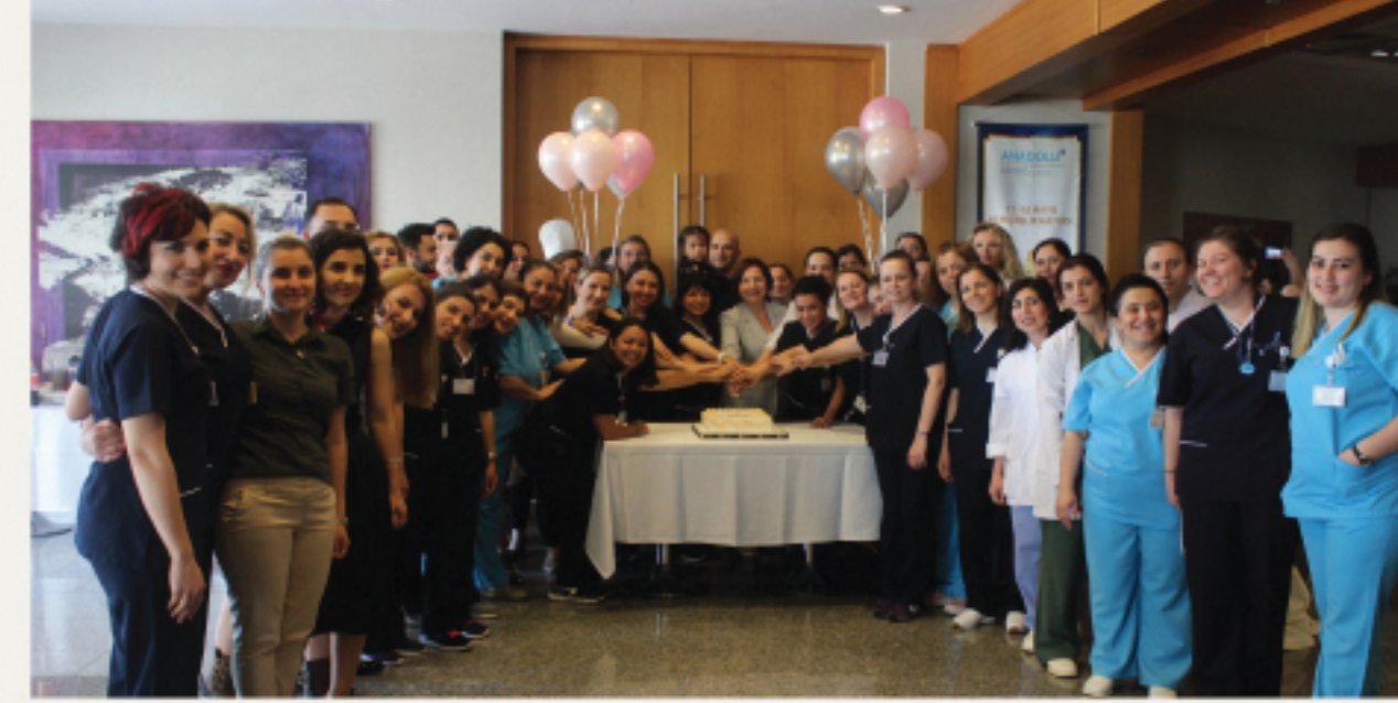
Hemşirelik Haftası çeşitli etkinliklerle kutlandı